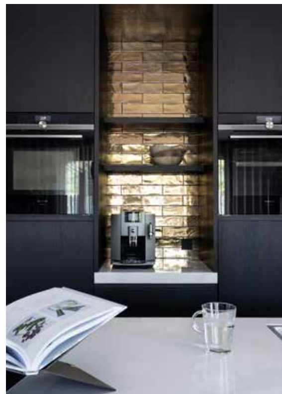
De keuken, wijnkast en de open doorkijk naar de trap zijn een ontwerp van AVA Interieurs, op maat gemaakt door Heijmans Timmerwerken.